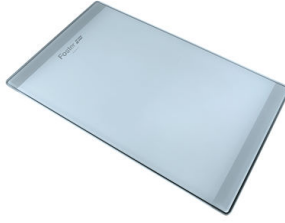
Tabla de corte de cristal 8631 300